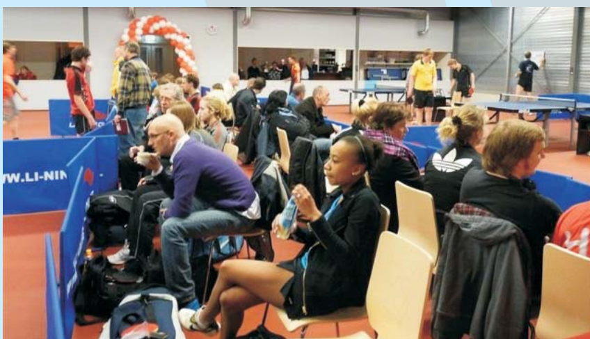
Competitiewedstrijden van HTC's sterkste teams trekken veel aandacht.